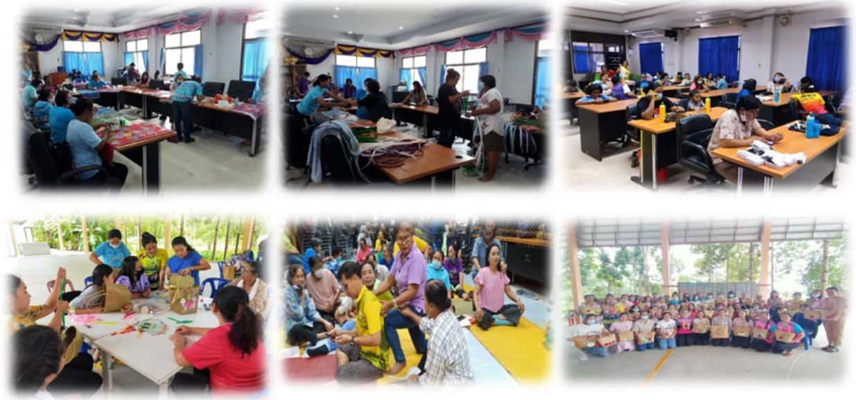
กิจกรรมหลัก ส่งเสริมคุณภาพชีวิตผู้ประสบปัญหาด้านสังคมและอาชีพ (ฝึกอาชีพ)

๓) โครงการพัฒนาเศรษฐกิจชุมชนฐานรากและชุมชนเข้มแข็ง งบประมาณ ๒,๓๒๖,๙๐๐ บาท