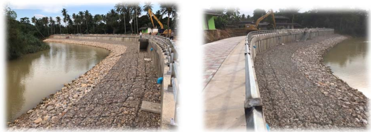
ก่อสร้างเขื่อนป้องกันตลิ่งแม่น้ำสวีหนุ่ม ความยาว ๒๐๐ เมตร บริเวณหมู่ ๒ ตำบลนาสัก อำเภอสวี จังหวัดชุมพร